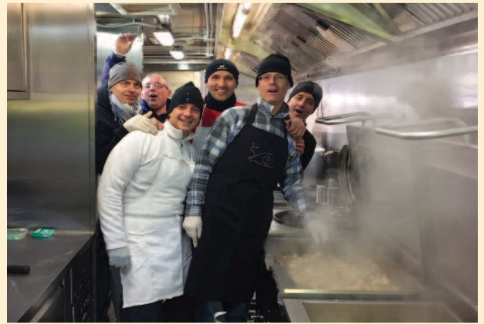
Un ringraziamento particolare alla delegazione della Contrada della Chiocciola intervenuta a dare una mano alle popolazioni colpite dal terremoto