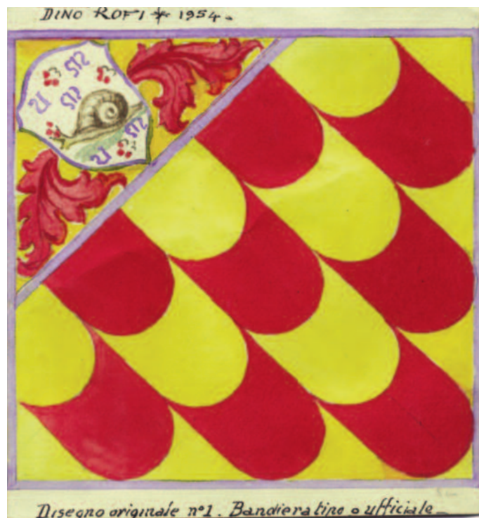
Disegno originale n°1. Bandiera tino o ufficiale