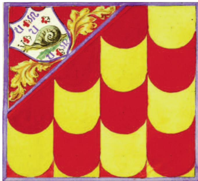
Disegno n°2 variante al tino esistente